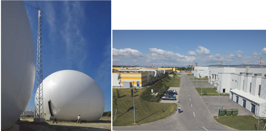
Рисунок 4. Очистные сооружения