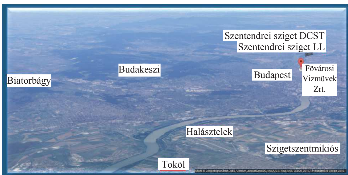
Рисунок 2. Станция очистки сточных вод и сеть канализации агломерации