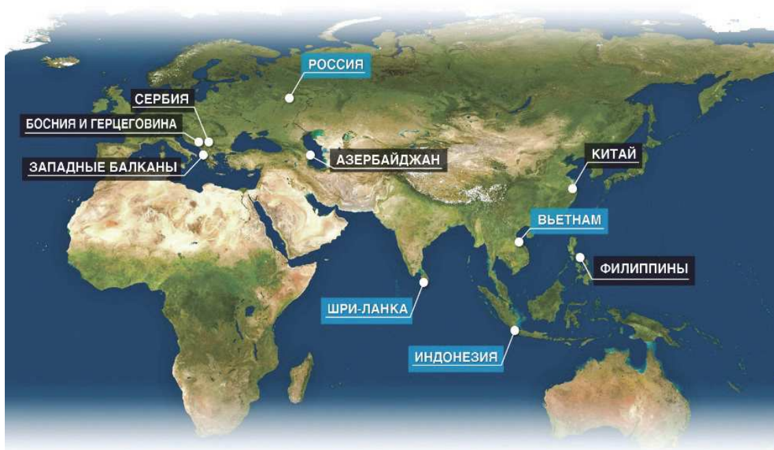
Рисунок 1. Международная деятельность